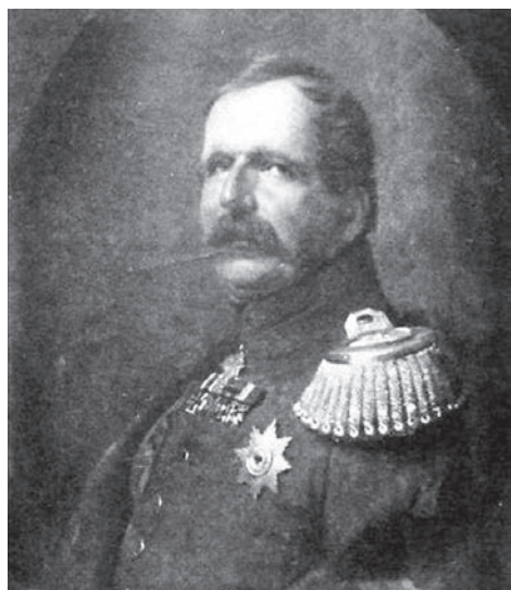
Малюнак 3. Вільгельм Радзівіл

Каму была прададзена нябораўская нумізматычная калекцыя? Ці ўся калекцыя манет і медалёў была распрададзена? Такія пытанні ўзнікаюць у сувязі з тым, што ўнук Міхала Гераніма Вільгельм Радзівіл (1791–1870) (малюнак 3) з’яўляўся заснавальнікам нумізматычнай калекцыі, якая доўгі час захоўвалася ў Берліне, а затым у Нясвіжскім палацы.