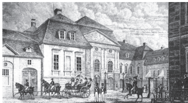
Малюнак 7. Палац Радзівілаў у Берліне, каля 1830 г.