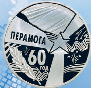
Дизайн: С. Некрасова Чеканка: ЗАО «Литовский монетный двор»