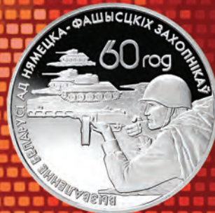
Дизайн: С. Заскевич, Е. Вишнякова Чеканка: ЗАО «Литовский монетный двор»

красное знамя, которое позже стали называть Знаменем Победы – одним из символов победы в Великой Отечественной войне. На монете в честь юбилея великой Победы вместо традиционной легенды размещается только памятная дата «1945–2005», обрамленная лентой ордена Славы. Эта дата сама по себе является знаковой, что позволяет ей занять центральное место в поле композиции. На аверсе этой монеты для передачи цветных элементов ордена Победы также впервые в истории белорусских памятных монет была применена технология тампопечати.