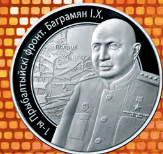
Дизайн: С. Заскевич Чеканка: ООО «Монетный двор Финляндии»