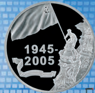
Дизайн: С. Некрасова Чеканка: АО «Монетный двор Польши»