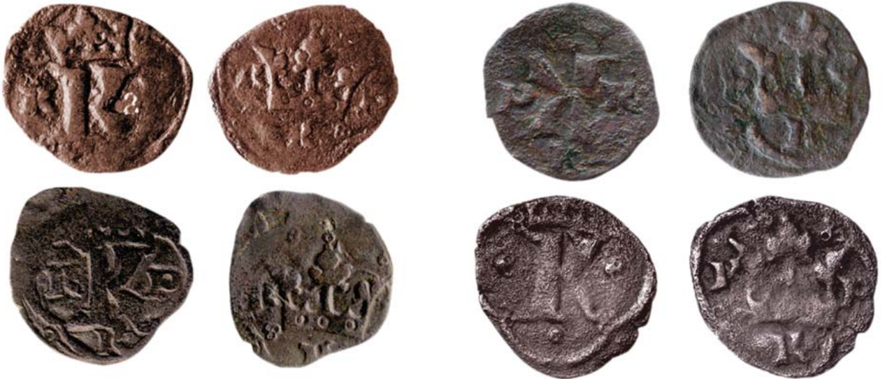
Монеты первого периода, чеканенные с 1353—1355 гг. до 1360 г.