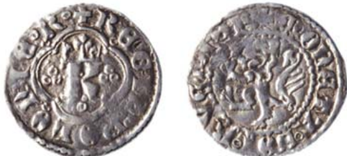
Разновидность 1 "в", но с лапами "1".