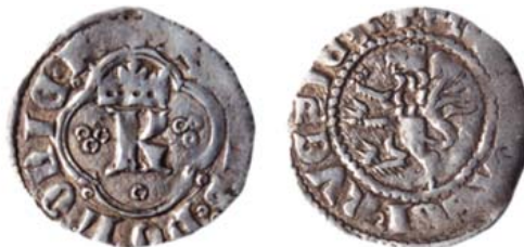
Разновидность 1 "д".