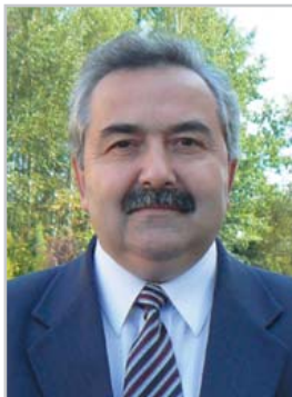
Вице-президент Украинского нумизматического общества

Галицко-русские медные денарии чеканили во Львове во времена правления королей Казимира III (1349—1370), Людовика Венгерского (1379—1382) и его полномочного наместника Владислава, князя Опольского (1372—1378), когда Галицкая Русь входила сначала в Польское Королевство, а потом в объединенное Венгерско-Польское государство, оставаясь при этом отдельной территорией, находящейся в непосредственном владении упомянутых королей, приравненной, выражаясь исторической терминологией, к родовым домам монархов.