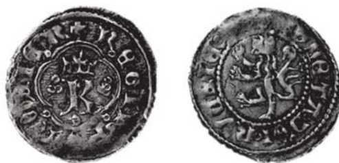
Разновидность 1 "б".