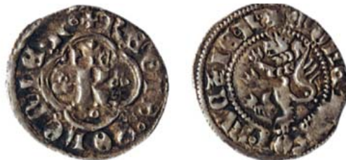
Разновидность 1 "в", но с лапами "2".