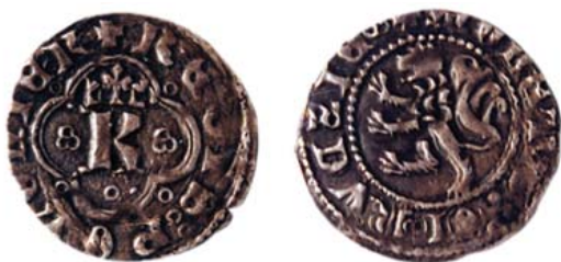
Разновидность 1 "а".