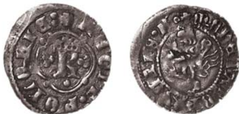
Разновидность 1 "г".