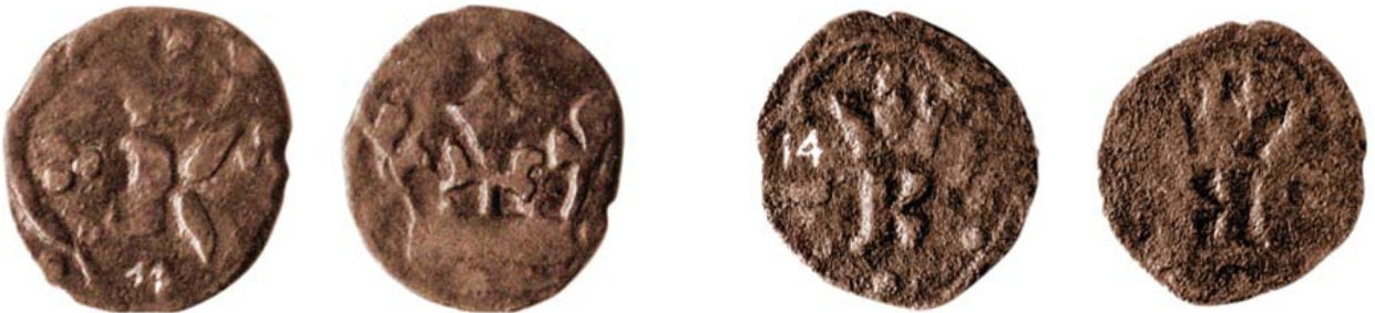
Монеты первого периода, чеканенные с 1360 г. до 1370 г.