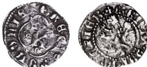
Разновидность 1 "е" с ошибкой в слове "MONTA".