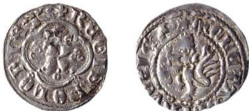
Разновидность 1 "е".