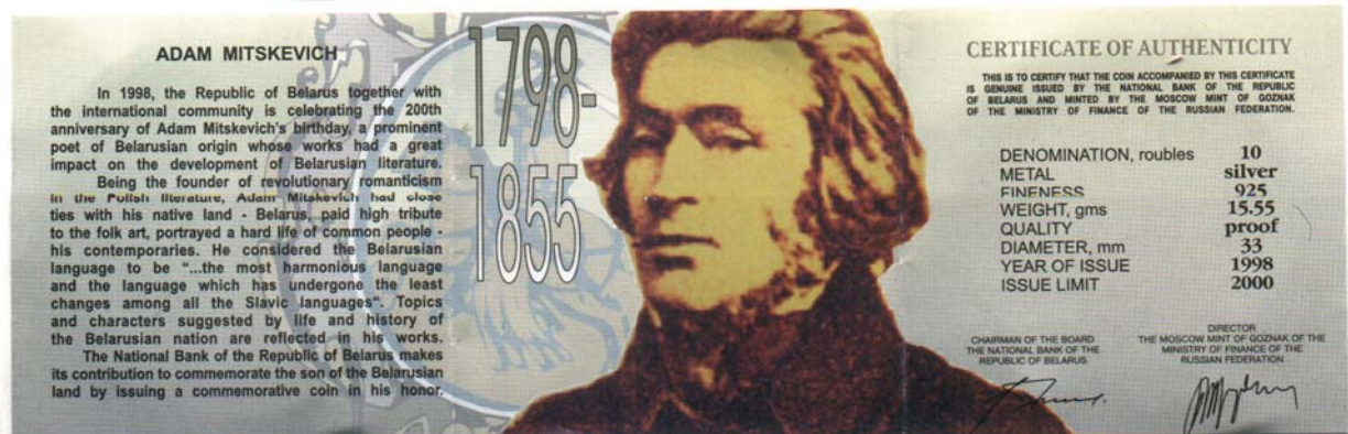
Изображения вариантов монет: с ошибкой (1854) в дате жизни поэта и поправкой (1855), а также прилагаемые к ним сертификаты.

кевича в датировке лет указана цифра, сократившая на год продолжительность его жизни, то есть "1798—1854" вместо "1798—1855". При таком конфузе срочно закрутилась "машина реабилитации". Еще через три месяца на Московском монетном дворе были заново отчеканены оба тиража памятных монет (достоинством 1 рубль и 20 рублей) с правильной датировкой жизни великого поэта.