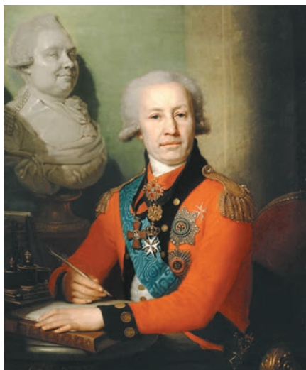
Рисунок 1. В.Л. Боровиковский. Портрет графа А.И. Васильева в мальтийском виц-мундире. Около 1800 г. ГРМ

Вкратце остановившись на принятых мерах и ходе реализации «плана», министр задается вопросом: «Основательны ли выгоды в нем предполагаемые, и следует ли произвести в государстве столь общую операцию без важнейшей какой-либо или для правления, или для государства пользы?». И далее по пунктам опровергает ранее, казалось бы, незыблемые доводы.