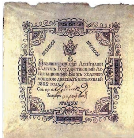
Рисунок 2. Ассигнация образца 1802–1803 гг. достоинством 25 руб.

Далее А. Васильев вообще ставит под сомнение необходимость ассигнацию и монету «основывать на металле», если «достоинство той и другой от онаго не зависит»: «Да и как ему зависеть от него, когда кусок золота, можно, единым начертанем, сделать маловажнее куска бумаги?»; «Надо быть младенцу или полоумному, чтобы дать за империял сторублевую ассигнацию, хотя и можно ее, в рассуждении