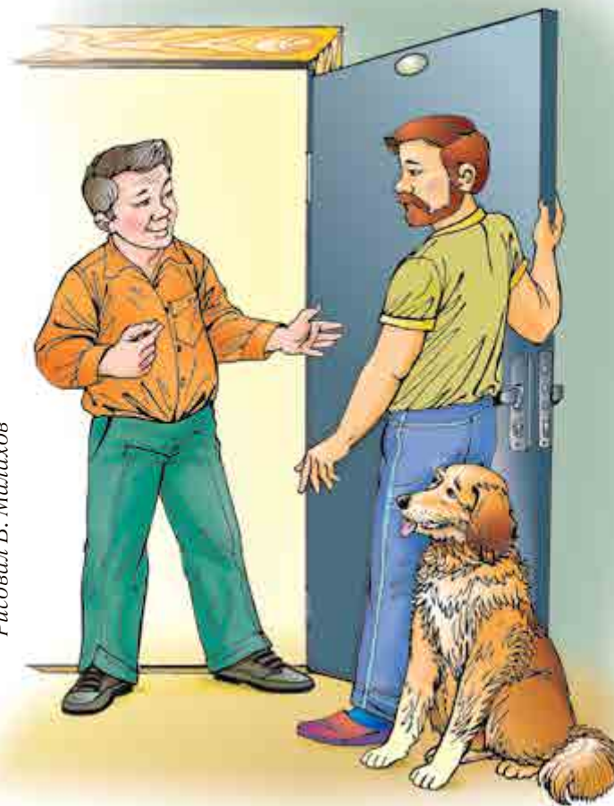
Рисовал В. Малахов

Доходы от трудовой деятельности. Проще говоря, это зарплата. Зарплаты у всех людей разные. Они зависят от того, какое образование у человека, какую должность он занимает и как хорошо выполняет свою работу. Будущую карьеру вы можете планировать уже сейчас, пока ещё учитесь в школе. Подумайте, чем вам хотелось бы заниматься, выберите подходящую профессию. К окончанию школы вы уже будете знать, куда пойти учиться, где потом работать, на какую зарплату рассчитывать.