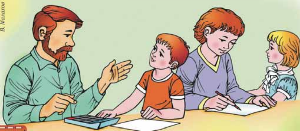
Рисовал В. Малахов