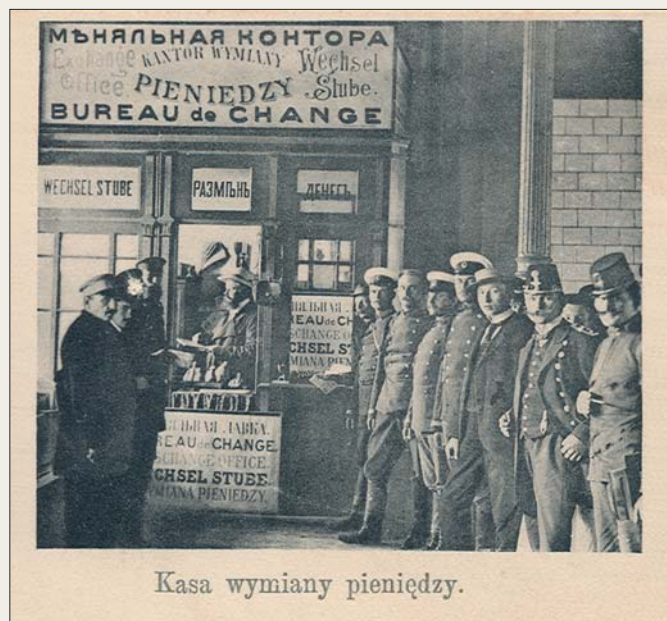
Меняльная контора на границе России с Германией (конец XIX в.).

Таким образом, можно сделать вывод, что с конца XIX в. почтовая открытка выполняла не только свои основные функции, но и рекламно-образовательные.