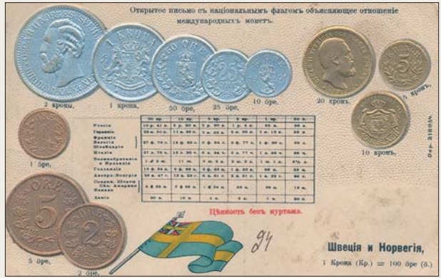
Почтовая открытка с валютой Швеции и Норвегии (начало XX в.).