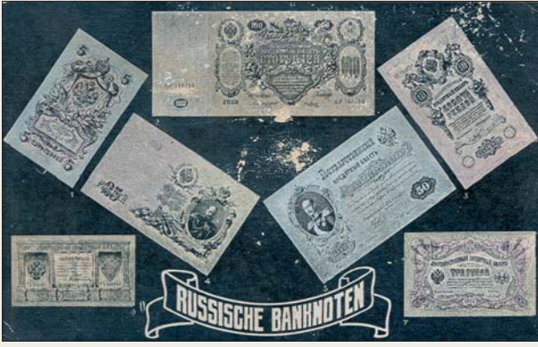
Немецкая открытка с денежными знаками Российской империи (начало XX в.).