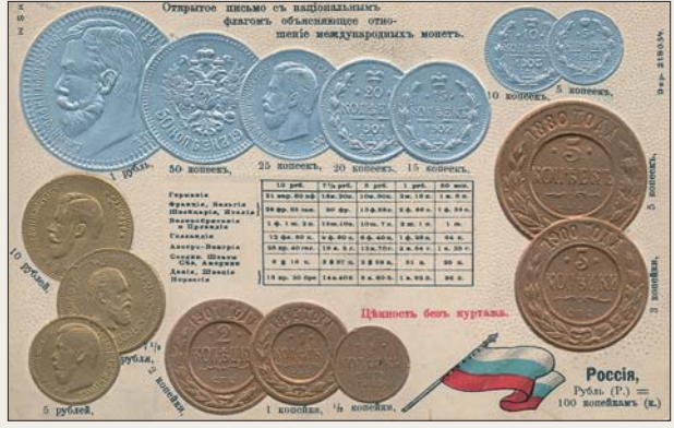
Почтовая открытка с валютой Российской империи (начало XX в.).