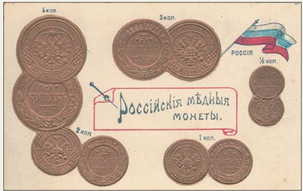
Почтовая открытка с медными монетами Российской империи (начало XX в.).