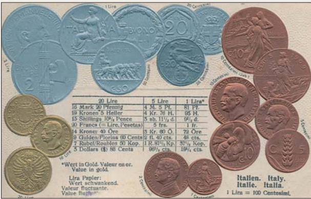
Почтовая открытка с валютой Италии (1932 г.).