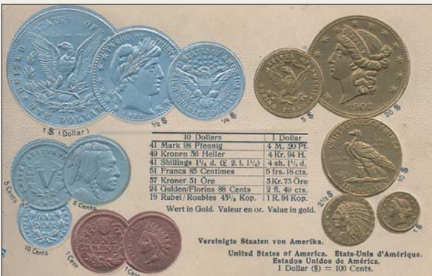
Почтовая открытка с валютой США (начало XX в.).