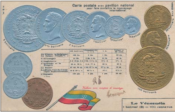
Почтовая открытка с валютой Венесуэлы (начало XX в.).