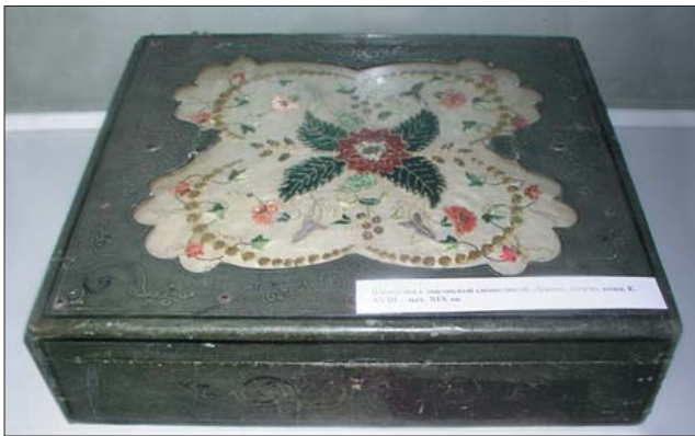
Шкатулка с масонской символикой (конец XVIII — начало XIX в.).

2. Памятники гражданского быта и общественной жизни. Среди них насчитывалось около 1500 серебряных и медных монет разного достоинства, гражданские ордена, охотничьи принадлежности, образцы кафеля и изразцов. Широко представлены настенные и памятные медали польские, французские, итальянские, шведские, еврейские, выполненные из серебра, бронзы, меди, свинца, чугуна, алюминия (около 300 наименований за период с XVIII в. по начало XX в.). Среди них настенные медали “Ядвига”, королева польская 1384—1399 гг., “Казимир IV Ягеллончик”, король польский 1447—1492 гг., с 1440 г. — великий князь Великого княжества Литовского, “Стефан Баторий”, государственный деятель, полководец, великий