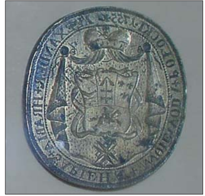
Печать Александра Сапеги — воеводы Полоцкого. 1755 г.

руси и Литве. Однако почувствовав, что деятельность масонов выходит из-под контроля, российские власти потребовали прекращения работы лож. В Российской империи они были закрыты в августе 1822 г., но продолжали действовать в глубоком подполье.