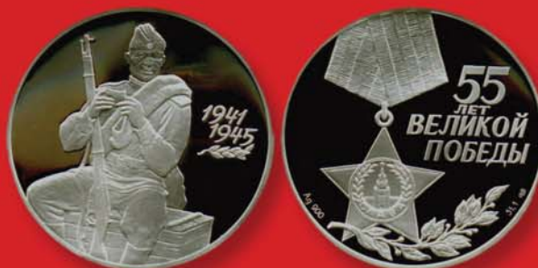
3 рубля 2000 г. Посвящены 55-летию Великой Победы. Россия, Ag-900.