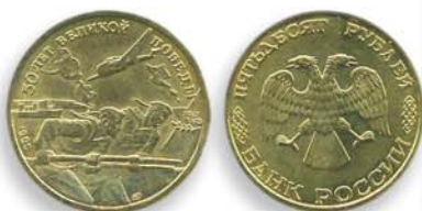
10, 20 и 50 рублей 1995 г. Посвящены 50-летию Великой Победы. Россия, Cu-Ni.