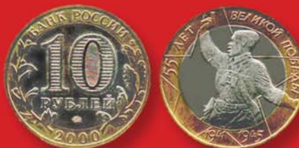
10 рублей 2000 г. Посвящены 55-летию Великой Победы. Россия, Cu-Ni.