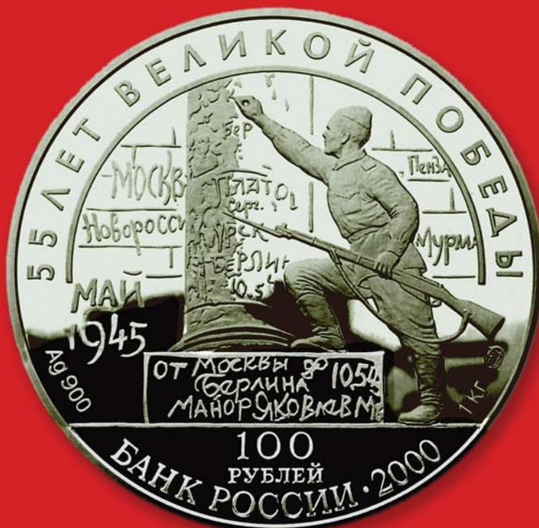
100 рублей 2000 г. Посвящены 55-летию Великой Победы. Россия, Ag-900, вес 1 кг.