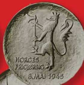
25 крон 1970 г. (Ag-875) и 200 крон 1980 г. (Ag-625). Посвящены 25-летию и 35-летию освобождения от немецко-фашистских захватчиков. Норвегия.