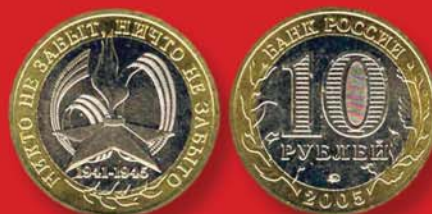
10 рублей 2005 г. Посвящены 60-летию Великой Победы. Россия, Cu-Ni.