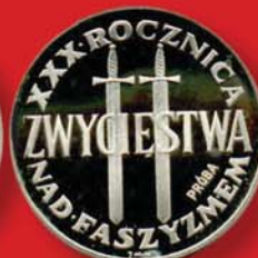
200 злотых 1975 г. (пробные). Посвящены 30-летию Победы над фашизмом. Польша, Ag-750.