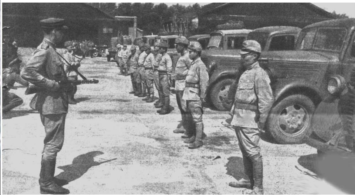
Передача японскими войсками машин и орудий представителям Красной Армии, август 1945 г.