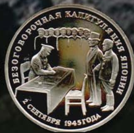
3 рубля 1995 г. Посвящены безоговорочной капитуляции Японии. Россия, Си-Ни.