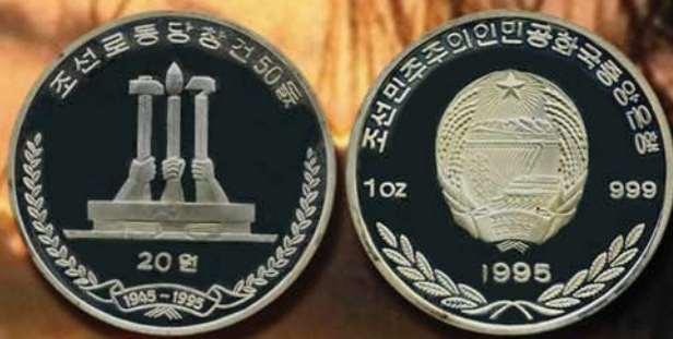
20 вон 1995 г. Посвящены 50-летию освобождения от Японии и образования Рабочей партии Кореи. Корейская Народно-Демократическая Республика, Ag-999.