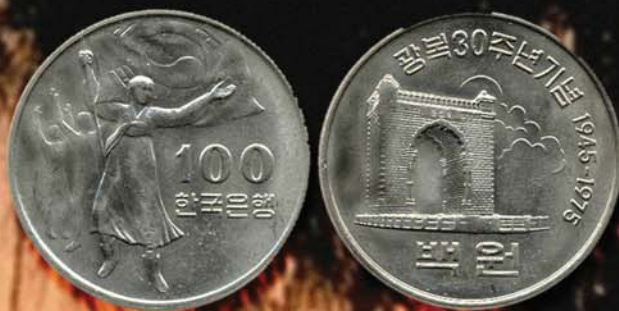
100 вон 1975 г. Посвящены 30-летию освобождения от Японии. Республика Корея, Cu-Ni.