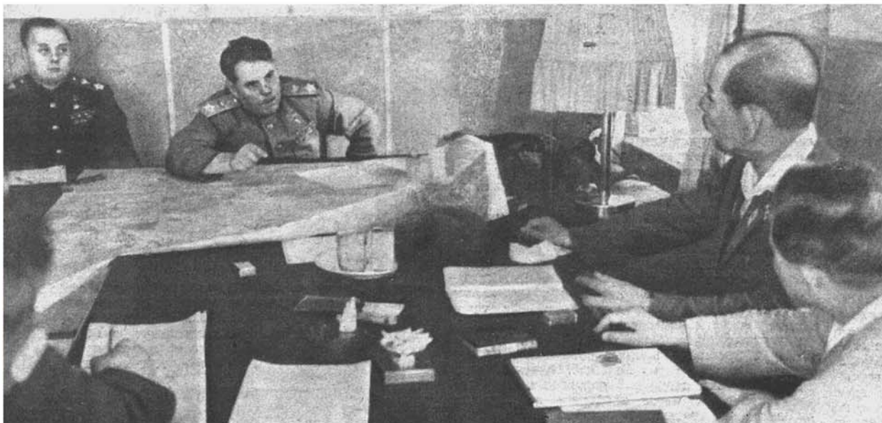
Маршалы Советского Союза А.М. Василевский (в центре) и К.А. Мерецков допрашивают начальника штаба Квантунской армии, август 1945 г.