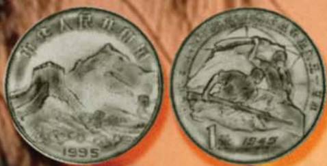
1 юнь 1995 г. Посвящен 50-летию разгрома фашистской Германии и Японии. КНР, никелин.