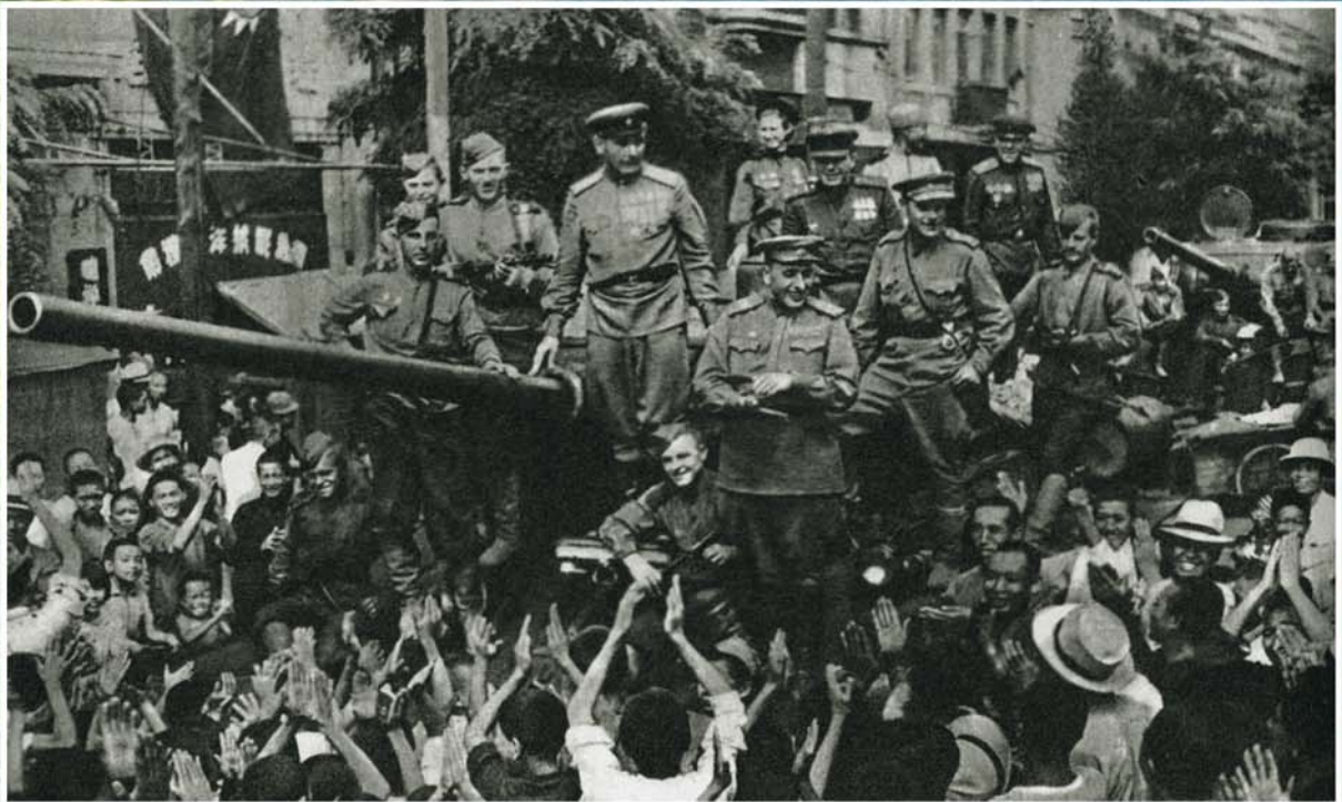
Трудающиеся Китая восторженно встречают советские войска (Дайрен, август 1945 г.).