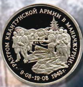
3 рубля 1995 г. Посвящены разгрому Квантунской армии в Маньчжурии. Россия, Си-Ни.