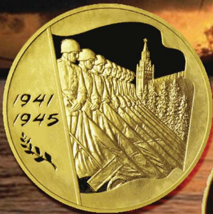
10 000 рублей 2005 г. Посвящены 60-летию Победы в Великой Отечественной войне. Россия, Au-999, вес 1 кг.